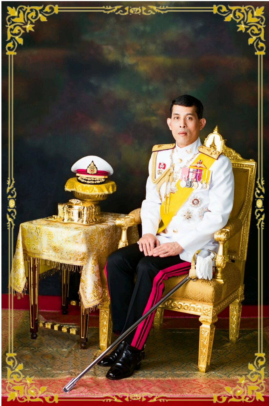
พระราชดำรัส